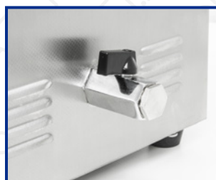
Valvola di scarico per i modelli DU-100 e AU-450