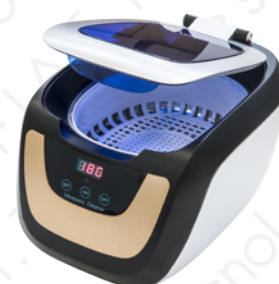
CE-5700A con cestello standard

L'intuitività e la sua versatilità di utilizzo lo rendono un elemento indispensabile per ogni laboratorio.