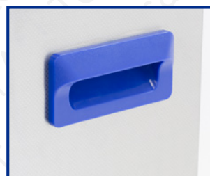
Maniglia per il trasporto