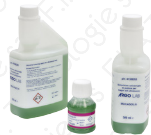
Soluzioni di pulizia universale