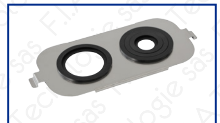
Supporto Becker per DU-45; DU-65; AU-65