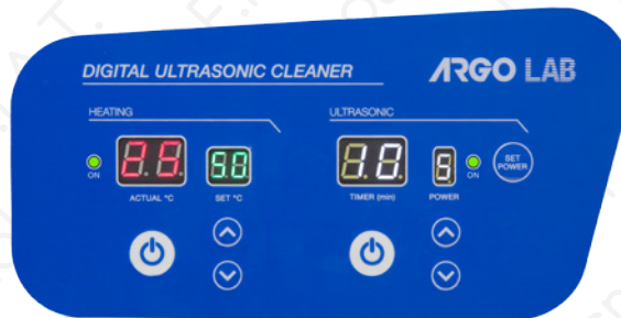
Pannello frontale serie DU