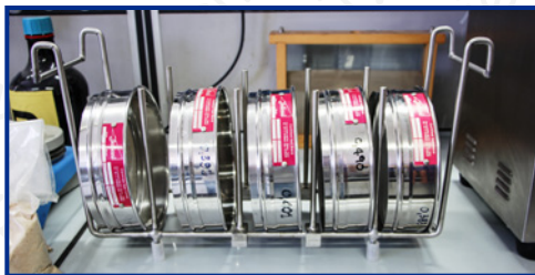
SS-200 con setacci