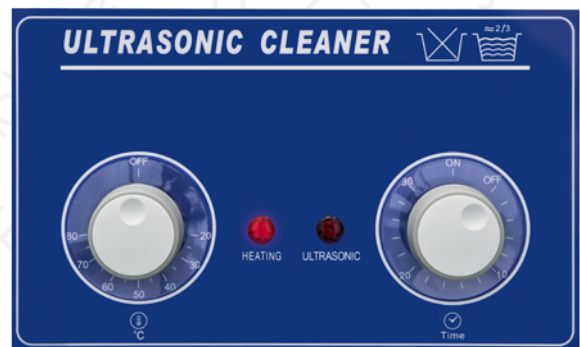
Pannello frontale serie AU