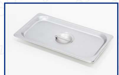
Coperchio in acciaio inox