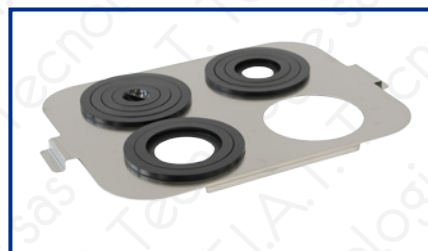
Supporto Becker per DU-100