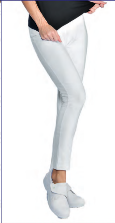
024610 LONG LEGGINGS

97% cotton • 3% spandex - 180 gr/m 2 S • M • L • XL • XXL BIANCO