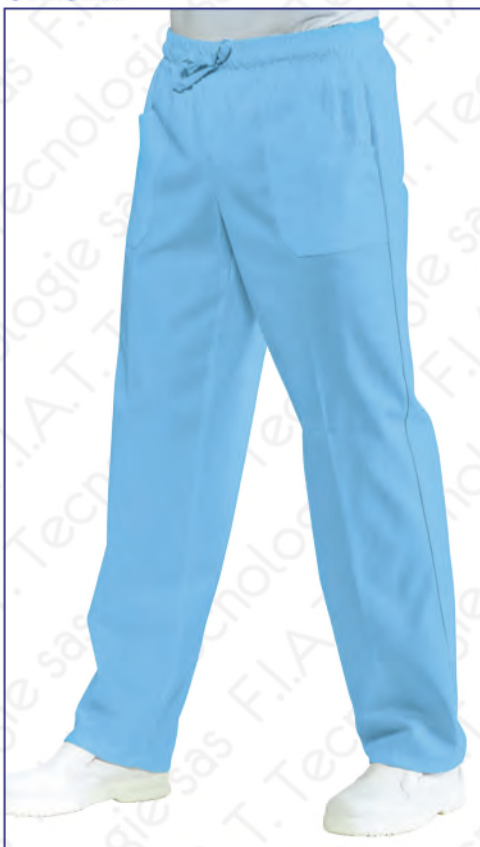
044042 PANTALONE CON ELASTICO 100% cotton - 185 gr/m 2 S • M • L • XL • XXL CELESTE