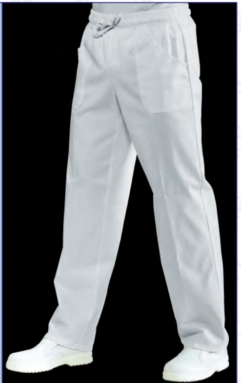
044409 PANTALONE CON ELASTICO 100% cotton satin 180 gr/m 2 S • M • L • XL • XXL BIANCO

SUPER DRY IL TESSUTO ANTIMACCHIA CHE RESPIRA THE ANTISTAIN FABRIC THAT BREATHES