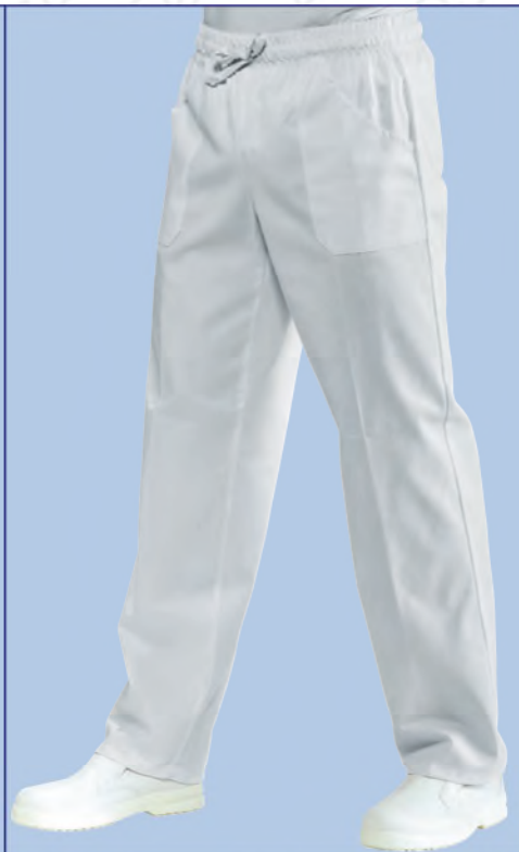
044300 PANTALONE CON ELASTICO 100% polyester super dry 130 gr/m 2 S • M • L • XL • XXL BIANCO

SUPER DRY IL TESSUTO ANTIMACCHIA CHE RESPIRA THE ANTISTAIN FABRIC THAT BREATHES