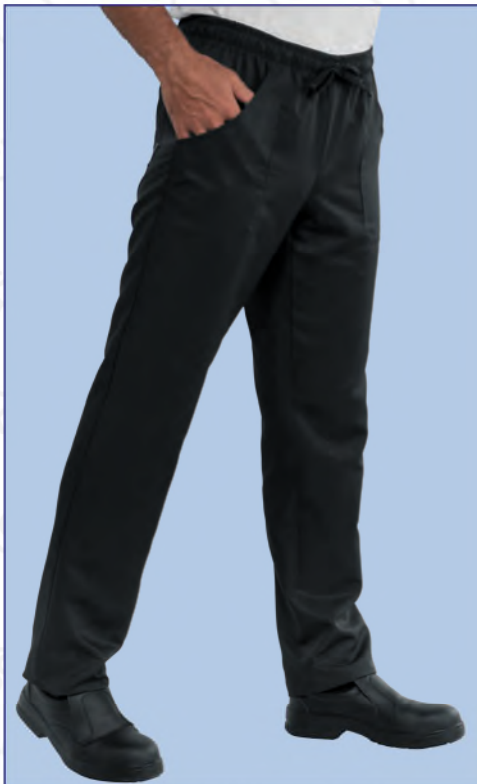
044301 PANTALONE CON ELASTICO 100% polyester super dry 130 gr/m 2 S • M • L • XL • XXL NERO

SUPER DRY IL TESSUTO ANTIMACCHIA CHE RESPIRA THE ANTISTAIN FABRIC THAT BREATHES