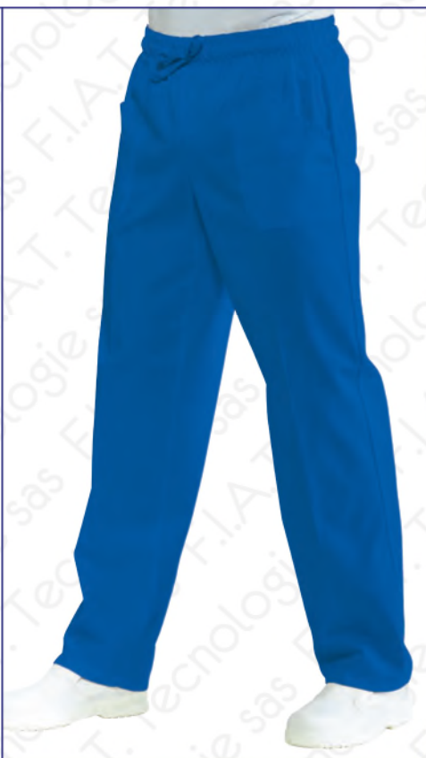
044400 PANTALONE CON ELASTICO 100% cotton - 185 gr/m 2 S • M • L • XL • XXL AZZURRO