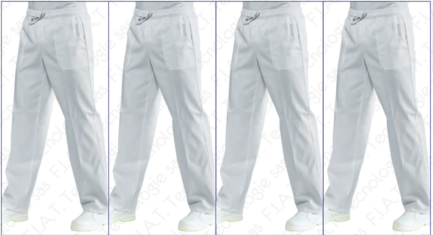
044600 PANTALACCIO BIANCO 100% cotton 210 gr/m 2 S • M • L • XL • XXL BIANCO