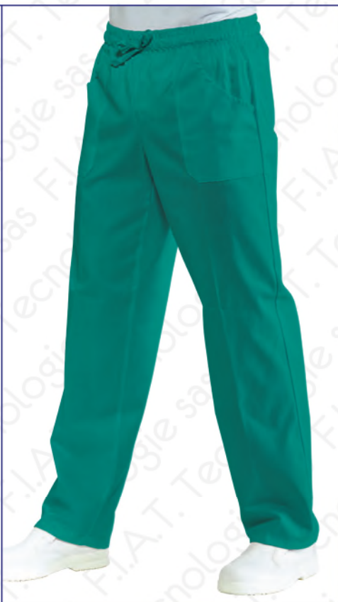
044200 PANTALONE CON ELASTICO 100% cotton - 185 gr/m 2 S • M • L • XL • XXL VERDE