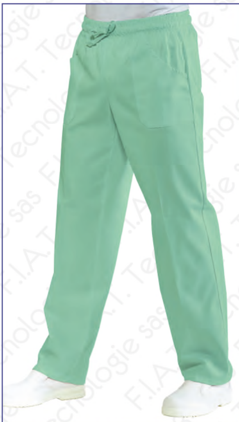
044049 PANTALONE CON ELASTICO 100% cotton - 185 gr/m 2 S • M • L • XL • XXL VERDINO