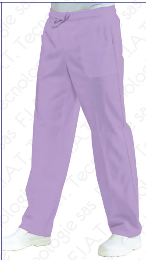
044427 PANTALONE CON ELASTICO 100% cotton - 185 gr/m 2 S • M • L • XL • XXL LILLA