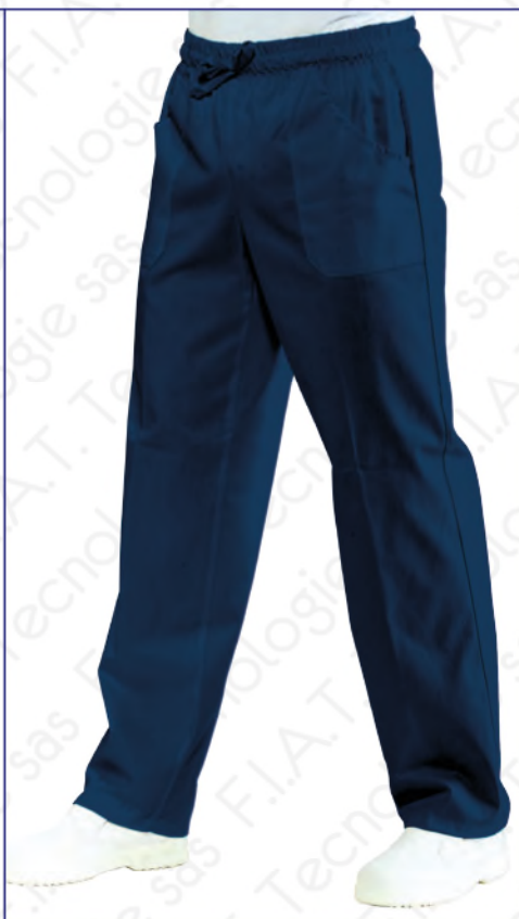
044402 PANTALONE CON ELASTICO 100% cotton - 185 gr/m 2 S • M • L • XL • XXL BLU